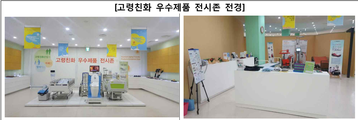
[고령친화 우수제품 전시존 전경]

성남 고령친화종합체험관에는 연인원 2만여 명 이상의 복지 및 보건 계열 종사자, 고령친화산업 종사자와 고령자들이 방문하고 있습니다. 체험관에서는 국내 우수 고령친화제품을 발굴하여 제품에 대한 소비자 인지도를 제고하고 제품의 판로 확보 및 홍보를 위해 「고령친화 우수제품 전시존」을 운영하고 있습니다. 국내 고령친화제품의 우수성을 소비자에게 알리고, 제품 홍보 및 판로 개척을 「고령친화 우수제품 전시존」에 동반협력기업의 많은 지원 바랍니다.